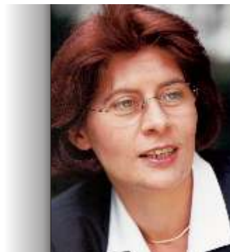
Renate Sommer a Parlament környezetvédelmi, közegészségügyi és élelmiszer-biztonsági bizottságának póttagja

Különösen a zöldek azok, akik horrosztikus forgatókönyveket dolgoznak ki és népszerűsítnek, ahelyett, hogy gyakorlatias módon tájékoztatnák a polgárokat a GMO-król. Az emberek természetesen összezavarodnak és ezért ellenségesen viszonyulnak a kérdéshez. Sok nemzeti politikus és kormány pedig katasztrofális módon reagál: újra a populizmus és az ideológiailag motivált obstrukcionizmus uralja a GMO-vitát. Ráadásul nyilvánvaló hatalmi harc folyik az Európai Bizottságon belül: míg mind az egészségügyi és fogyasztóvédelmi, mind a mezőgazdasági felügyelet támogatja a GMO-k iránti gyakorlatias és pozitív viszonyulást, a környezetvédelmi felügyelet